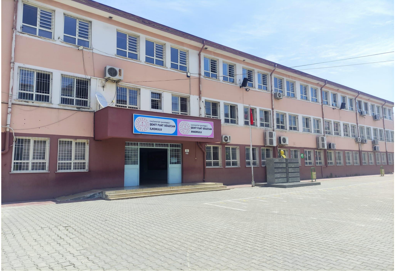
ŞEHİT FUAT OĞUZCAN İLKOKULU